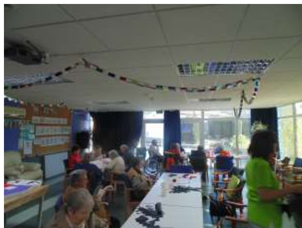
Retallant ratpenats, mussols,...