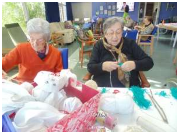
Fent escombres petites