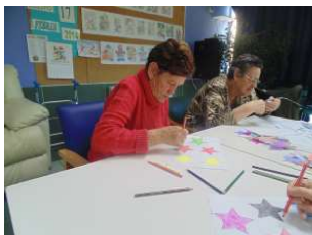
Preparant les disfresses pel dia del ball