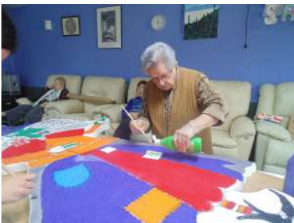
Pintant la bruixa